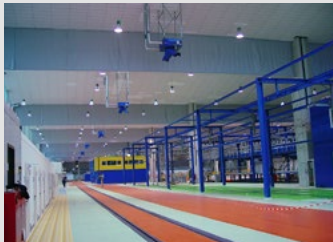
Das System lässt sich einfach und schnell an die vorhandene Gebäudestruktur befestigen

Mit vorgefertigten Metallmanschetten lassen sich problemlos Durchdringungen in verschiedenen Größen und Formate herstellen.